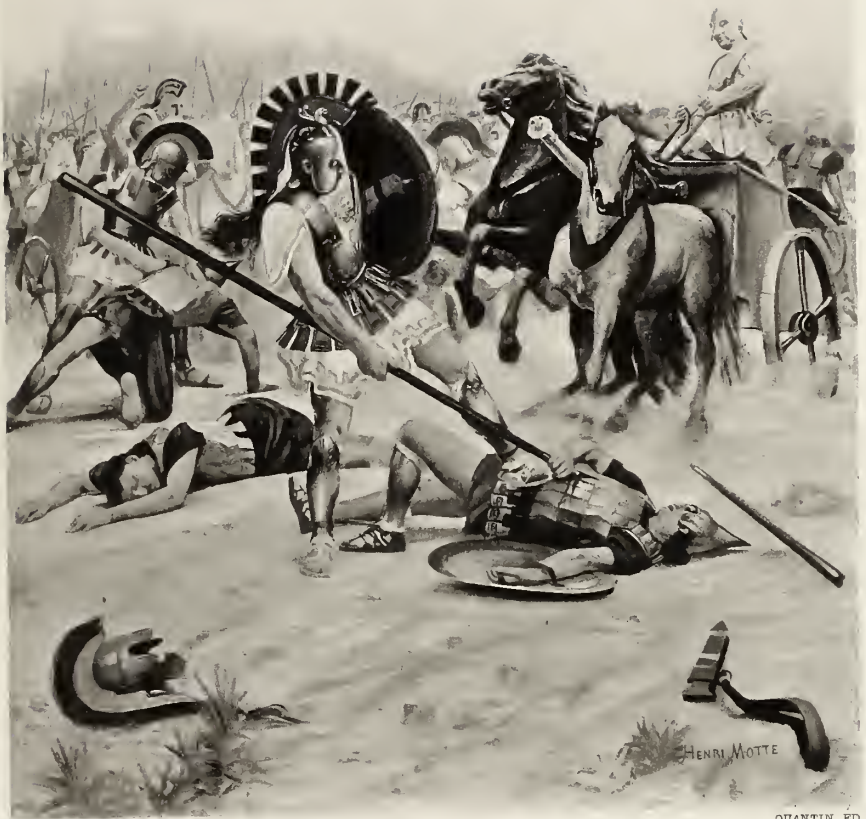
H. MOTTE. INV.